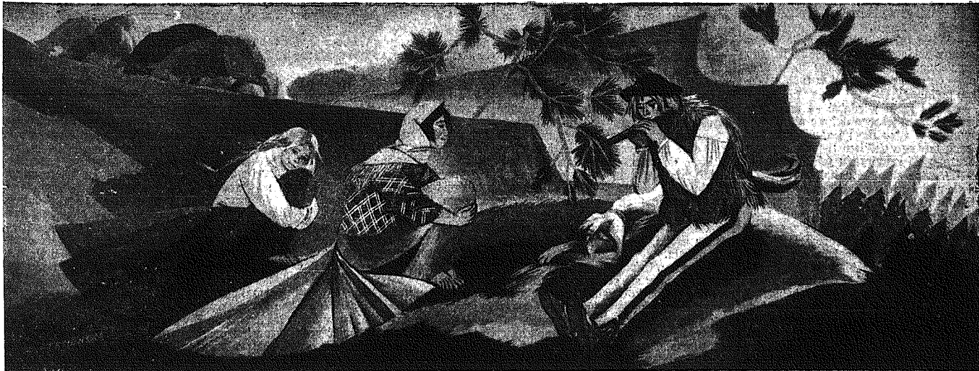
Plakone motywy góralskie z naszych Tair znajdują szerokie zastosowanie w sztuce zdobniczej.

Przy tej sposobności delegacja poruszyła sprawę przejścia na etat krajowy prywatnych szkół polskich, posiadających wymagane do tego warunki oraz wręczyła ministrowi Czernemu memorandum stronnictw polskich o systematycznym wynaradawianiu Polaków w Czechosłowacji.