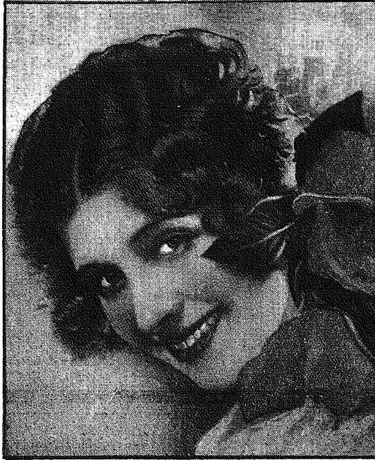
Włosna powabna, wonna i świeża, Złocąc się blaskiem słońca promieni, Wkrótce już sprawi całej przyrodzie Nowy płaszcz piękny z milej zieleni.

szczono bony na sumę 32 miliardów fr., i to bony nie „bajońskie”, a prawdziwe, które trzeba kiedyś wykupić, w Niemczech roboty te przybrały postać wyraźnych zbrojeń, najmniej może w skutecznosc robót tych wierzą w Anglii. Innych źródeł sfinansowania tych przedsięwzięć niema, gdyż ani za granicą pieniędzy nie pożyczyc, ani też