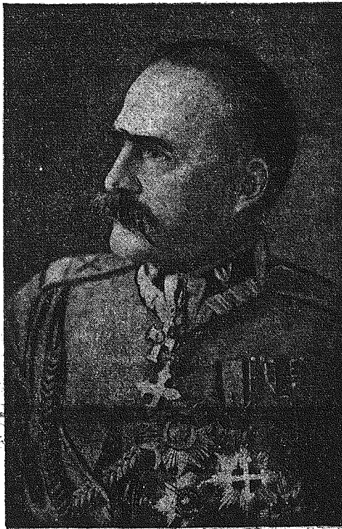
JÓZEF PIŁSUDSKI, Pierwszy Marszałek Polski, którego dzień imienin 19marca obchodzony będzie uroczystie

Naszym zdaniem byłoby to znów najmniej słuszne rozwiązanie sprawy, nale-