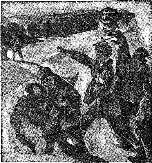
Puszysta warstwa śniegu Pokryła grubo pola, Ról chłopów wygląd żywało, Rozpoczęła się swawola

Katolicy których jest w Państwie Polskiem około 75 proc. mają prawo spodziewać się, iż miarodajne czynniki rządowe wejrzą, choćby w imię spokoju publicznego, w tę akcję bezbożniczą w której kryje się komunizm. Społeczeństwo katolickie, dotknięte w swoich uczuciach religijnych, nie mogłoby dłużej ścierpieć, by kilka masoniów bezkarnie znieważała instytucję Boską, jaką jest Kościół katolicki i musiałoby jakoś odpowiednio stanowisko i postawę wobec bezczelnej agresywności bezbożników.