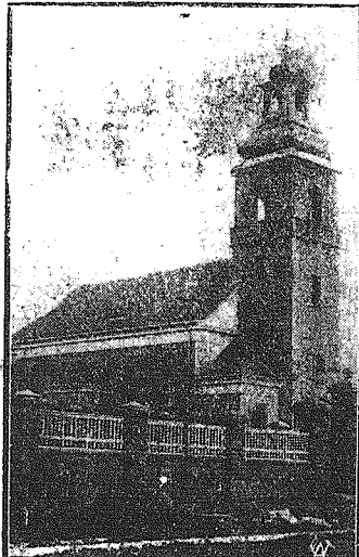
Nowy kościół. We wsi nadgranicznej Makoszowce (pow. Kępno) odbyło się w tych dniach uroczyste poświęcenie nowowbudowanego kościoła. Konsekracji kościoła dokonał osobiście J. E. ks. kardynał prymas Hiłond.