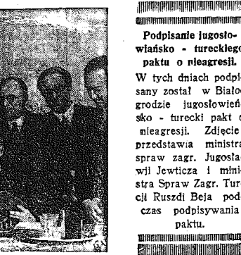
Podpisanie jugosłowiańsko-tureckiego paktu o nieagresji. W tych dniach podpisany został w Białogrodzie jugosłowiańsko-turecki pakt o nieagresji. Zdjęcie przedstawia ministra spraw zagr. Jugosławii Jewitciza i ministra Spraw Zagr. Turcji Ruszdi Beja podczas podpisywania paktu.

W Debreczynie doszło ponownie do demonstracji przeciwko studentom żydom, którym specjalna straż studencka broni dostępu do uniwersytetu.