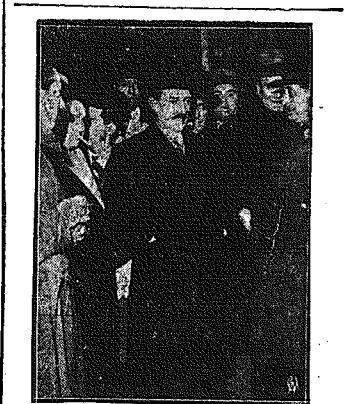
Nowy szef rządu francuskiego. Nowy szef rządu francuskiego Chautemps po wyjściu z pałacu Elizejskiego udziela wywiadu prasie paryskiej.

Już wielki czas zareklamować w „Gońcu Częstochowskim” TOWARY ŚWIĄTECZNE Reklama tylko w piśmie poczytnym nie zawodzi!!