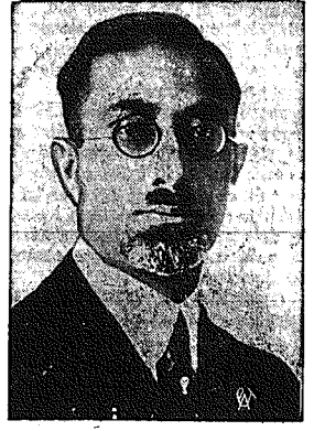
Zamordowanie króla Afganistanu. Król Afganistanu Mahomed Nadir Chan, zamordowany przez swych dworzan w Kabulu.

Dookoła niemieckiego ogniska niepokoju powstać musi mur, który będzie mógł w danym wypadku przeciwstawić się rozszerzeniu się nowej pozoży wojennej.