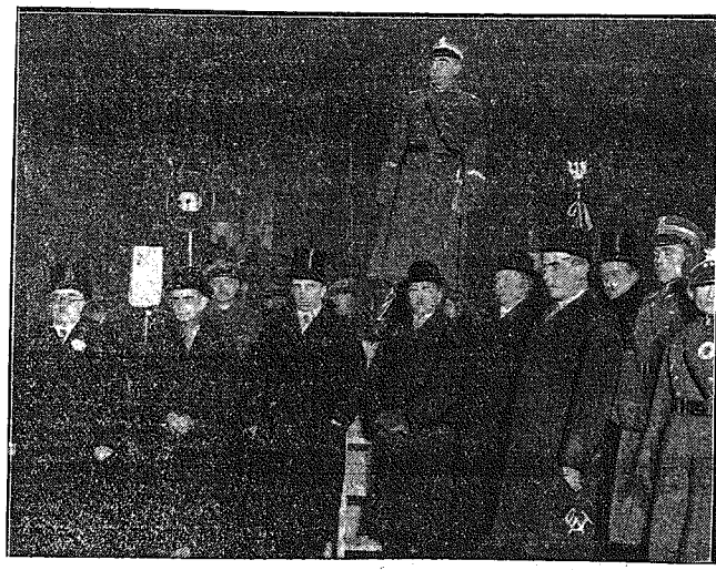
Podczas odsłonięcia pomnika poległych żołnierzy z P. O. W.

I właśnie nigdzie tak skutecznie nie podważono zasad samych pokoju jak w Genewie. Liga Narodów, która w myśli inicjatora Wilsona miała się stać strażnicą bezpieczeństwa i pokoju powszechnego, pod-