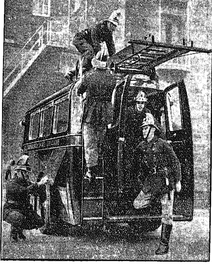
Straż pożarna w Glasgowie (Anglia) otrzymała nowe wozy, które mogą szybko przewozić na miejsce pożaru nietylko wozy, ale i wszystkie niezbędne rekwiizyty straży.

Na posiedzeniu francuskiej Akademii profesor d'Ocaigne zakomunikował o wyniku prac fizyków Maroget i Mourtier nad składem farb używanych przez mistrzów malarstwa w dawnych czasach.