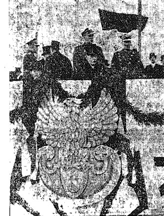
W 15-tą rocznicę Święta Niepodległości. Na lewo Pan Prezydent Rzeczypospolitej prof. Mościcki w swej łodzi podczas rewii na Placu Mokotowskim w dniu święta 15-lecia Niepodległości. Na prawo — Pan Marszałek Piłsudski przyjmując defiladę na polu Mokotowskim.

W dwóch podstawowych branżach rynku włókienniczego t. j. bawełnianej i wełnianej sytuacja w zakresie zbytu kształtowała się niepomyślnie.