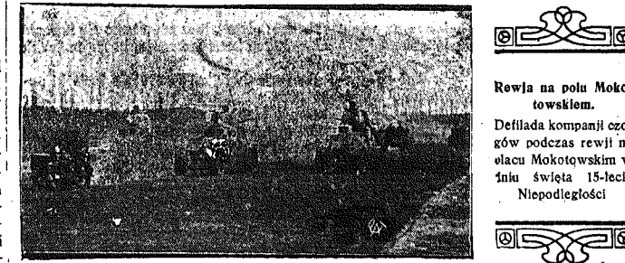
Rewja na polu Mokotowskim. Defilada kompanii czołgów podczas rewii na placu Mokotowskim w dniu święta 15-lecia Niepodległości

Po poświęceniu ołtarza J. E. ks. kardynał dokonał uroczystego aktu wmurowania relikwii, poczem po dokonaniu reszty ceremonii celebrans, ubrany w pontyfikalne szaty, zajął miejsce na tronie po lewej stronie nowoposwieconego głównego ołtarza. Wkrótce przybył do kościoła p. Prezydent Rzplitej w otoczeniu swej świty, członkowie rządu, oraz liczni zaproszeni goście. W między czasie nową