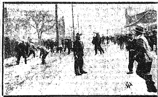
Zaburzenia strajkowe w Ameryce

W kołach City londyńskich powątpiewają, czy prezydentowi Rooseveltowi uda się opanować spadek dolara i zatrzymać go w odpowiedniej chwili. Równocześnie odbywa się ucieczka kapitałów z Paryża do Londynu.