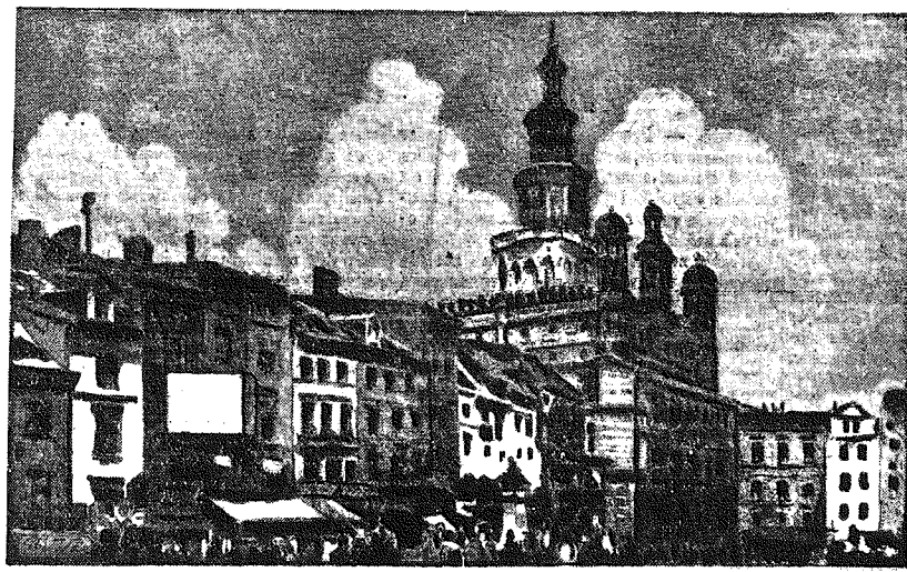
Starożytny ratusz na Starym Ryнку w Poznaniu.

Ponieważ Kościół katolicki z założenia i postannictwa swojego jest instytucją uniwersalną powszechną, przeznaczoną dla całego swiata i dla całej ludzkości, państwa zaś, jako takie, są instytucjami partykularnymi, — przeto Kościół musi wchodzić w stosunki z każdym państwem i rządem, w jakiegokolwiek formie one się ustala. I te dwie władze, tj. Kościół i Państwo określały pomiędzy sobą wzajemny stosunek przez umowę, zwaną konkordatem. Wtedy tylko każda z tych dwóch społeczności i władz będzie uznawała i szanowała prawa drugiej, a wzajemna zgoda będzie podstawa do współpracy i do pomysłnego rozwoju obu społeczności autorytatywnych i Kościoła i Państwa.