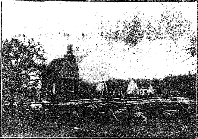
Kościół lotników i automobilistów.

Prus, który szykuje się do obrony. Wzrósł on z pośród pruskich oddziałów szturmowych swoje pretoriańskie kohorty; podczas gdy Hitler organizuje parady S.S. w Berlinie i na prowincji, Goering odby-