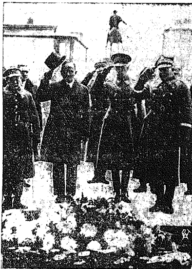
W Dniu Zadusznym.