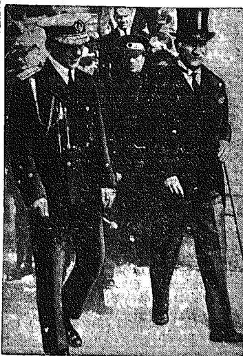
Król gustawski z wizytą w Turcji. Król Aleksander był w Stambule serdecznie powitany przez Mustafę Kemal Paszę (z prawej strony od centralnego).

Rząd Stanów Zjednoczonych wyraził zgodę na wydelegowanie oficjalnego przedstawiciela do rady administracyjnej, która będzie wspomagać Wysokiego Komisarza.