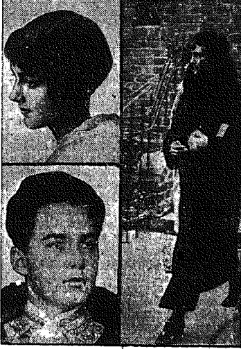
B. cesarzowa Zyta wyleciała do Rzymu, gdzie została przyjęta na dworz królewskim, w Watykanie i przez Mussoliniego. Chodził o pozyskanie Włoch dla kandydatury jej syna najstarszego Ottona na tron węgierski. W związku z tymi planami, mówił się o zaślubinach córki króla włoskiego Marji z Ottomem. Na ilustracji obok B. cesarzowa Zyta i księżniczka włoska Maria i Otto Habsburg.