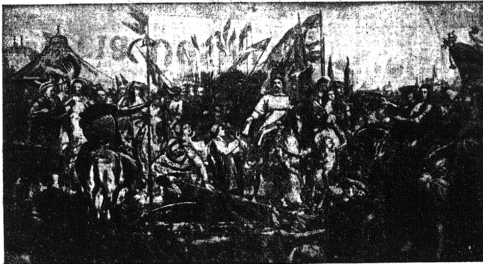
Król Jan III Sobieski pod Wiedniem według obrazu Jana Matejki.

Na polski wysiłek zbrojny złożyły się wszystkie województwa Rzplitej, jednakże udział poszczególnych dzielnic nie był jednakowy. Husaria pochodziła przeważnie z województw małopolskich i wielkopolskich. Najwięcej piechoty i dragonji dostarczyły ziemie północno - zachodnie, lekka jazda pochodziła przeważnie z województw wschodnich. Zaciąg obejmował cały obszar Rzplitej od Dniepru po Wartę, od Karpat do Bałtyku. Tak więc wyprawa wiedeńska była wynikiem ogólnego zbrojnego wysiłku całego społeczeństwa pol-