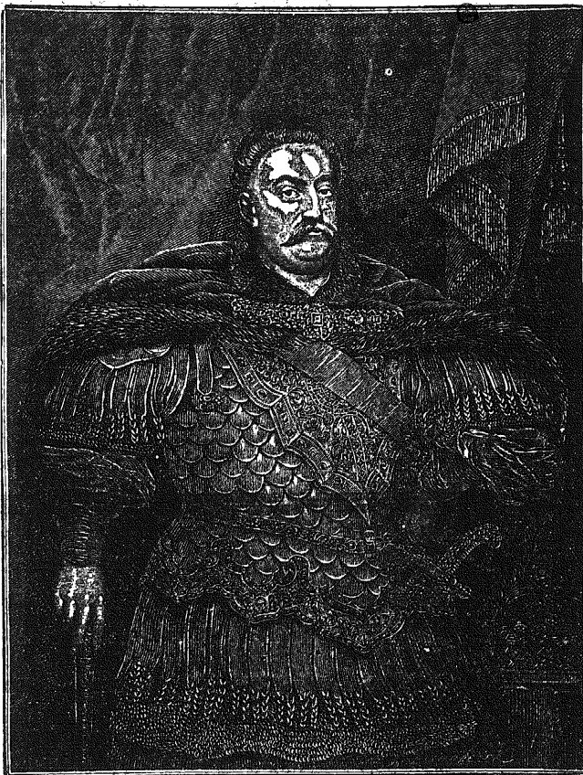
KRÓL JAN III SOBIESKI