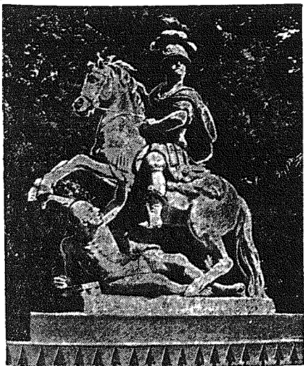
Posąg króla Jana III w Warszawie w Łazienkach, dłuta Franciszka Pincka.