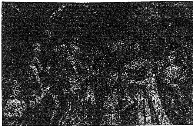
Maria Kazimiera, królowa wraz z dziećmi przy portrecie Jana III.

września uroczystość Imienia N. M. Panny, którą papież Innocenty XI nakazał obchodzić z powodu tego świetnego zwycięstwa. Polska przez swoją wierność Bogu, Kościołowi i Stolicy Apostolskiej stała się sławną w dziejach narodów. W 50-tą rocznicę zwycięstwa pod Wiedniem