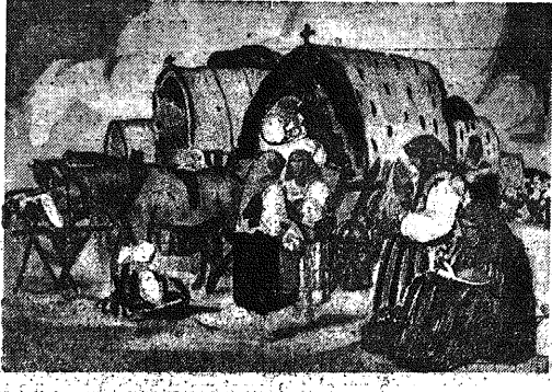
Tabela pielgrzymki wiejskiej. Mal. Allard Olivier.