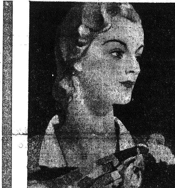
Nieznane są oczy twoich głębie, Zagadkę kryłła twe lica: Może kochać umiesz, jak gołębie, Niewinnie, jak anielca.

W wielu krajach rok 1933 przyniósł poprawę sytuacji. Niestety, Polska nie należy do tych krajów.