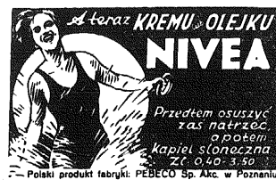
— Polski produkt fabryki: PEBECO Sp. Akc. w Poznaniu

Władze zarówno celne, jak i policyjne zwracają uwagę na dziwny fakt, iż pomimo ogłoszonego przez żydów boikotu towarów niemieckich, przemysł ich z Niemiec nie ustaje, owszem w ostatnim czasie intensywnie się wzmacnia. Dotyczy to zwłaszcza m. in. sacharyny, której całe transporty przechodzą z Niemiec i sprzedawane są przez handlarzy żydów szczególnie na prowincji.