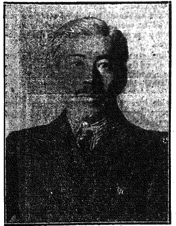
Zgon pastera japońskiego w Warszawie. Poseł japoński przy rządzie polskim Hiruoki Kawai zmarł w ub. poniedziałek w sanatorium w Otwocku.

Jak już wczoraj donosiliśmy w Otwocku zmarł poseł japoński minister Hiruoki Kawai. Przed zgonem swym min. Kawai wyraził życzenie przejścia na wiarę katolicką, której gorliwymi wyznawcami jest małżonka pastera i jej trzy córki. Pos. Kawai wyznawał dotychczas religię „Szinto”, najbardziej rozpowszechnioną w Japonii. Czyniąc zadość życzeniu ciężko chorego, małżonka pastera uprosiła dziekana korpusu dyplomatycznego J. E. ks. arcybiskupa Marmaggi, nuncjusza apostolskiego, ażeby przybył do Otwocka. W poniedziałek o godzinie 3-iej po poł.