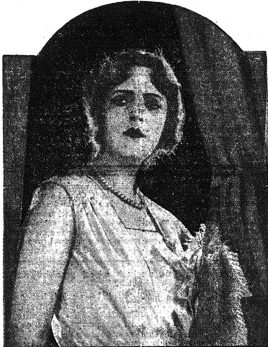
Odybśmy samo tylko czcili piękno Jemu stawiali oltarze Przed tobą każdy chętnie by klęknął I ulóś by wszystko ci w darze.