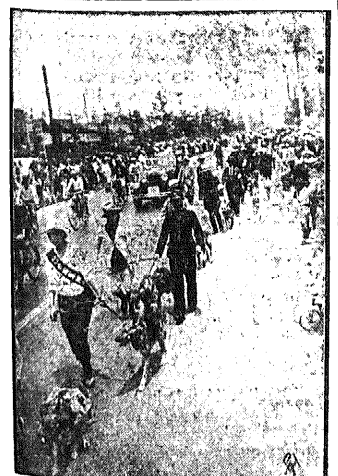
Czworonozny przyjaciel żołnierza. Na zdjęciu naszym widzimy defiladę psów i ich opiekunów z Czerwonemu Krzyżu japońskiego przed pałacem Mikada w Tokio.

Specjalny nacisk kładzie się na produkcję samolotów