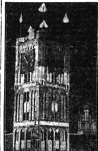
Zabytek toruński. Na pierwszym planie naszego widziemy wieżę ratusza toruńskiego, a dalej w głębi wież kościoła N. M. Panny w świetle reflektorów.