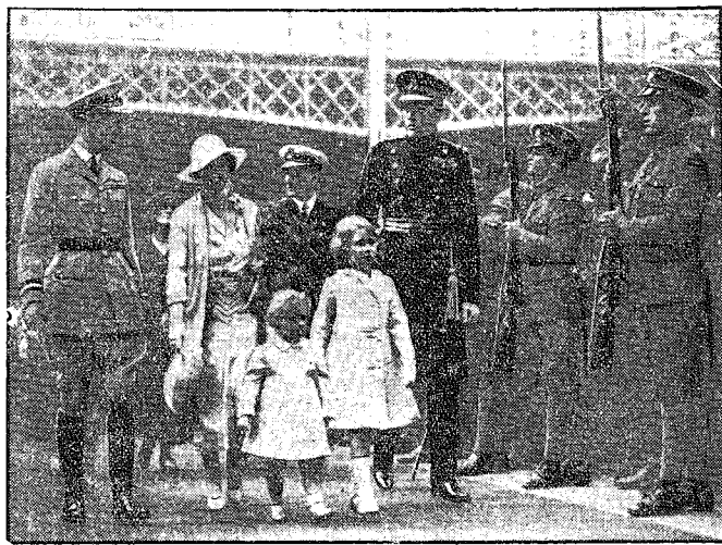
Przyszła królowa Anglii. W towarzystwie swego ojca księcia Jorku (na lewo), drugiego syna króla angielskiego, oraz swej matki i młodszej siostrzyczki, udając się na widwisko wojskowe, odbiera honory wojskowe. Księżniczka Mary jest starszą wnuczką króla Jerzego i według prawpanującego domu angielskiego po księżki Walii jest drugą następczynią tronu Wielkiej Brytanii.

Berlin. — Rząd Rzeszy przygotowuje wielką akcję produkcyjnej pomocy gospodarczej dla Prus Wschodnich. Akcja ta przewiduje przede wszystkim industrializację tej dotychczas agrarnej prowincji przez zakładanie filii wszystkich większych przedsiębiorstw przemysłowych w Prusach Wschodnich, w szczególności przemysłu metalowego i tekstylnego i to nie w miastach, lecz na prowincji w powiatach mało zaludnionych, aby przyciągnąć znowu robotników na Wschód nie krańce Rzeszy. Przewidziana jest również na wielką skalę rozbudowa dróg wodnych, budowa nowych kanałów etc. Rentowność nowych przedsięwzięć w Prusach Wschodnich ma być zagwarantowana w ten sposób, że przedsiębiorstwa te zarówno przy dostawach państwowych, jak i prywatnych, mają być w pierwszej linii uwzględniane. W dziedzinie kulturalnej przewidziane jest przekształcenie uniwersytetu królewskiego na uniwersytet narodowy, oraz budowa wielkiego teatru narodowego. Cała ta akcja kryje w sobie nie tylko cele gospodarcze, lecz i wysocje polityczne, a mianowicie przyciągnięcie ludności z Zachodu na Wschód do tej dziś rzekomo wyludniającej się prowincji, a to „celem szybszego stworzenia wafu ochronnego w zagrożonych terytorjach”. Jak zdradza otwarcie jeden z dzienników, ma nastąpić teraz wskrzeszenie średniowiecznej tradycji zakonu krzyżackiego na wschodnich rubieżach Rzeszy, czyli innymi słowy kulturalny pochód germanizmu na Wschód.