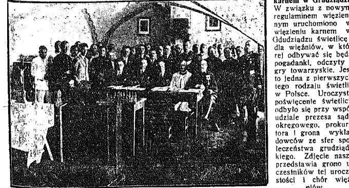
Światlica w wiedeńskim karczmie w Grudziądzu. W związku z nowym regulaminem więziennym uruchomiono w więzieniu karcem w Grudziądzu światlicę dla więźniów, w której odbywać się będą pogadanki, odczyty gry towarzyskie. Jest to jedna z pierwszych tego rodzaju światlic w Polsce. Uroczyste poświęcenie światlicy odbyło się przy współudziale prezesa sądu okręgowego, prokuratora i grona wykładowców ze ster społeczeństwa grudziądzkiego. Zdjęcie nasze przedstawia grono uczestników tej uroczystości i chór więźniów.

Pozatem wymalowali hitlerowcy na wszystkich drzwiach i sklepach w okolicy Grazu swastyki hitlerowskie.