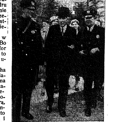
92-letni milioner John D. Rockefeller w drodze do kościoła baptystów, pod ochroną pilnujących go policjantów, których desygnowano w obawie przed bandytami, uprowadzającymi ludzi, którzy mogą dać większy okup za wypuszczenie na wolność.

bywa dane okazywanie Ducha dla pomiatu, przyzwykły różny rewolucje i wojny, żytku wspólnego. Jednemu przez Ducha katalizmy żywiołowe i przemiany spo-