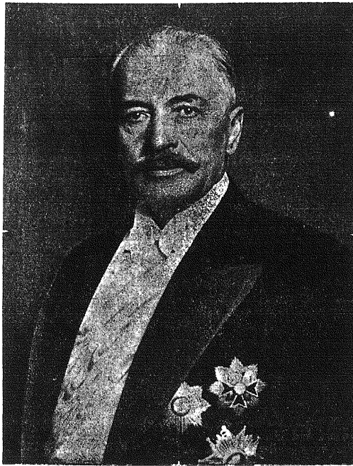
W dniu dzisiejszym obchodzi imieniny Najwyższy Dostojnik Państwa p. Prezydent Rzplitej prof. Ignacy Mościcki.