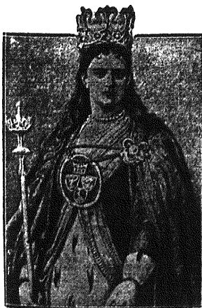
Artowa Jadwiga według obrazka Jana Matejki.