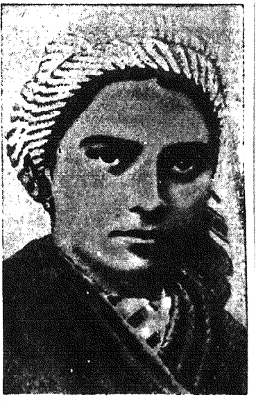
Blagosławiona Bernadetta Soubirous, której przed 75 laty objawiała się N. M. P. w Lourdes.

Wiedeń. — Z Aten donoszą: Na półwyspie Chalcedońskim dało się odczuć silne trzęsienie ziemi. O rozmiarach szkód brak wiadomości.