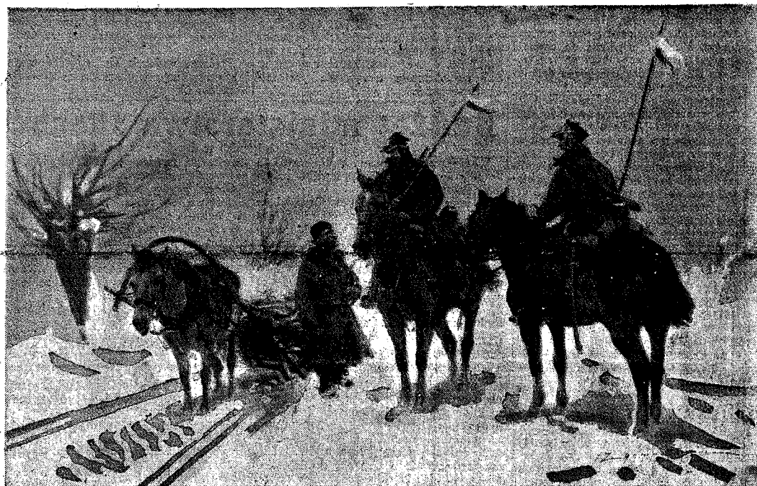
PATROL ULANSKI — Zabłakani gdzieś na śnieżystych bezdrożach kresów wschodnich dwa ulani wypytują się napoitanego kłmotka o najbliższą wioskę. Scenka taka posłużyła artyście malarzowi za temat do pięknego obrazu.

„Pomorza będziemy bronili mieczem i pazurami” — to już lepiej zrozumieją, przynajmniej ci, którzy rzetelnie i rozsądnie nie pragnęliby uniknąć nowej katastrofy wojennej. A jest ich, dzięki Bogu, jeszcze dość dużo w świecie.