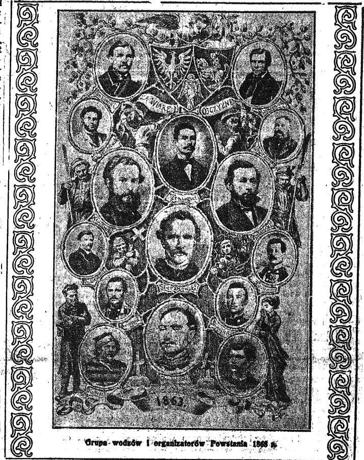
Grupa wodzów i organizatorów Powstania 1863 r.

Cały okres bohaterkich wprost legendarnych walk powstańczych — to jedyna, straszna nad miarę uciążliwa par-