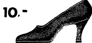
10.- Eleganckie i łgine czółenka z czarnegoksamitu zastępuje zamsk.