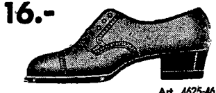
16.- Sportowy pantofelek z brązowego boku na niskim obcasie.