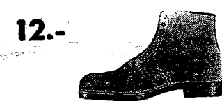
12.- 37-34 Brązowe buciki dla chłopców. Mocny dół, boks, skórzana podeszawa. Nr. 35-38 Zł. 16.-