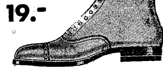
19.- Czarne sznurowane buciki z mocnego bokasu ze silną skórzaną podeszwą. S. 39-Pa