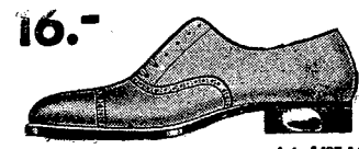
16.- Męskie brązowe lub czarne półbuciki z bo- 'su na skórzanej obcaszwie.