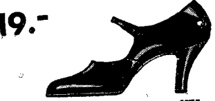
19.- Lakierowy pantofelek na paseczku. Zawsze modny i elegancki