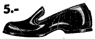
5.- Kolasze z językiem i bez języka. W naj- lepszym blacie zachowujące suche obwie.