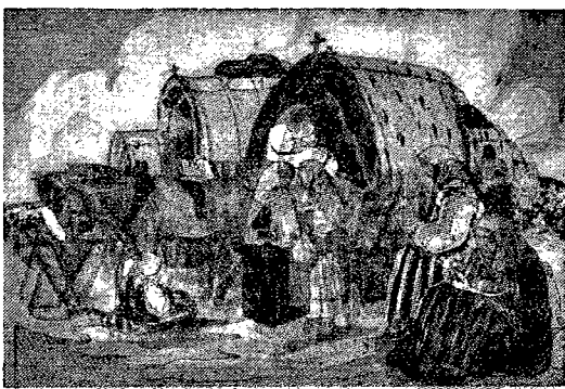
Tabor pielgrzymki wleśkiej w drodze na odpust do Częstochowy.

Spółeczna korzyść akcji pomocy bezrobotnym wzrosłaby również w wysokim stopniu w razie reformy podstaw akcji zasiłkowej. Dotychczas bowiem zasiłki dla bezrobotnych, udzielane były na podstawie formalnych uprawnień, przysługujących pozbawionym pracy. W rezultacie z zasiłków tych korzystały niejednokrotnie jednostki, posiadające bądź to osobisty majątek, bądź też inne źródła dochodu poza pracą. Oparcie akcji zasiłkowej na rzeczywistej sytuacji gospodarczej bezrobotnego, umożliwiłaby rozciągnięcie tej akcji na rzesze istotnie potrzebujących pomocy.