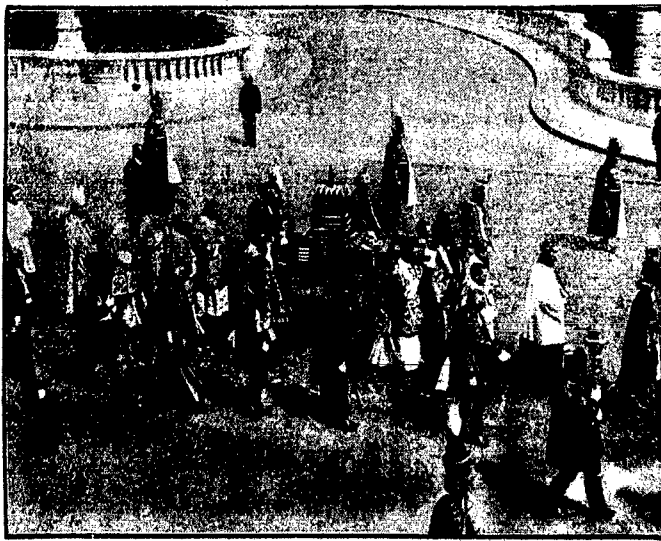
Obchód święta patrona Wegler w Budapeszcie.

Dorocznym zwyczajem obchodzone uroczyste w Budapeszcie dzień Sw. Stefana, patrona korony węgierskiej. Na ilustracji naszej widzimy fragment procesji z relikwiami Sw. Stefana. Miniaturę trumna niesiona jest przez duchowieństwo i otoczona przez przybranych w bogate stroje historyczne honwedów.