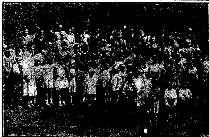
Półkolonia letnie w Rembertowie.