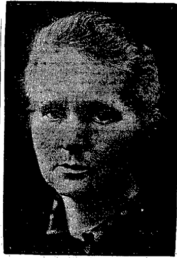
Pani Curie-Skłodowska przybyła do Warszawy. Dnia 27-go b. m. przybyła do Warszawy słynna uczona polska pani Curie-Skłodowska, celem wzięcia udziału w poświęceniu i otwarciu Instytutu Radowego. Na zdjęciu naszym podajemy podobiznę pani Curie-Skłodowskiej.