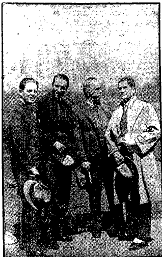
Artyści polscy w Ameryce.

Powieść Stephensonu wywoła niezawodnie wśród naszych czytelników równie silne wrażenie, jak wśród czytelników angielskich.