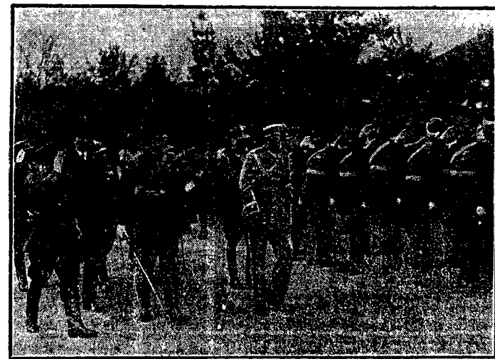
Z pobytu Marsz. Piłsudskiego w Rumunji. Zdjęcie przedstawia Marsz. Piłsudskiego, przechodzącego przed frontem 16 p. p. im. Marszałka Piłsudskiego w Falticeni.

Berlin. — „Deutsche Allgemeine Ztg.” donosi, że w najbliższych dniach rozpocznie się mają rokowania oficjalne między centrum a partją narodowo-socjalistyczną w sprawie utworzenia rządu koalicyjnego w Prusach. W związku z tem do Berlina przybędą: przewodniczący partji centrowej prałat Kaas i Hitler. Z początkiem maja odbędzie się kongres nadzwyczajny stronnictwa centrowego Prus, który zdecydować ma o przyszłej polityce centrum w Prusach. Już w ub. poniedziałek podjęli narodowi socjaliści nieoficjalne kroki, zmierzające do ustalenia platformy dla ro-