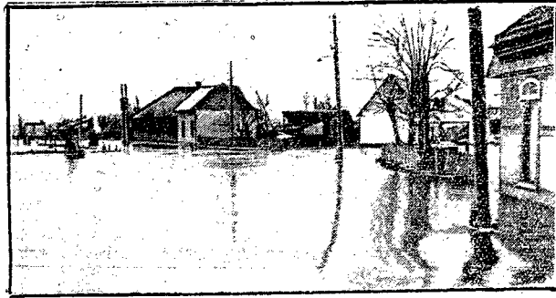
Katastrofa powodzi w Rumunji podczas obecnej wiosny szczególnie ciężko dotknęła miasto Arad, w którym przeszło sto domów uiniosła woda. Tysiące mieszkańców znalazło się bez dachu nad głową.

SOBOTA, 30 KWIEŃNIA. Katowice — fala 408,7 m. moc. 16 kw. 11:45 Przegląd bieżącej prasy polsk. z Warsz. 11:58 Sygnał czasu z Warsz. hejnał z Krakowa. 12:10 Poranek szkolny ze Lwowa. 12:45 Muzyka gramof. 13:20 Komunik. z Warsz. 14:55 Komunik. 15:05 Transm. z Warsz. 15:15 Intermezzo muz. 15:25 Przegląd wydawnictw z Warsz. 15:45 Intermezzo muz. 16:10 Odczyt z Warsz. 16:30 Skrzynka pocztowa dla dzieci. 17:10 Odczyt z Krakowa. 17:35 — 18:50 Transm. z Warszawy i Wilna. 18:50 Rozmaitości. 19:05 Feljton sportowy. 19:20 Odczyt. 19:45 — 22:30 Transm. z Warszawy. 22:50 Muzyka taneczna.