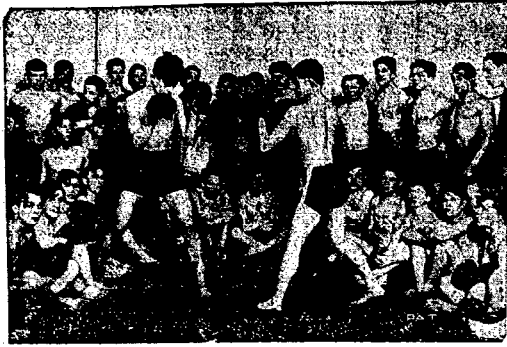
Boks w Polskiej Y. M. C. A. Obok szerokiej działalności kulturalno-wychowawczej, Polska YMCA biega jedną z pionierów racjonalnego wychowania fizycznego i gier sportowych, prowadzi w każdym ze swych „ognisk” specjalny dział wychowania fizycznego. Dział taki posiada również świe tlicę Polskiej YMCA dla chłopców pracujących i gaziery, uruchomioną przed kilkoma miesiącami w Warszawie. Zdjęcie przedstawia fragment z gry bokserskiej w powyższej świetlicy