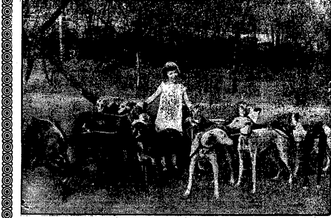
Angielskie charty wyścigowe.

Katowice — Iala 408,7 m. moc 12 kw. 10'25 Naboż. z kośc. pod wezw. Najśw. Marii