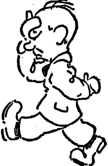
Głowa boli a ja nie mam oryginalnej Aspiriny... Piekło na ziemi.

Berlin. — Sąd przysięgłych w Pflauren (Sanksonja) ogłosił wyrok w procesie 27-