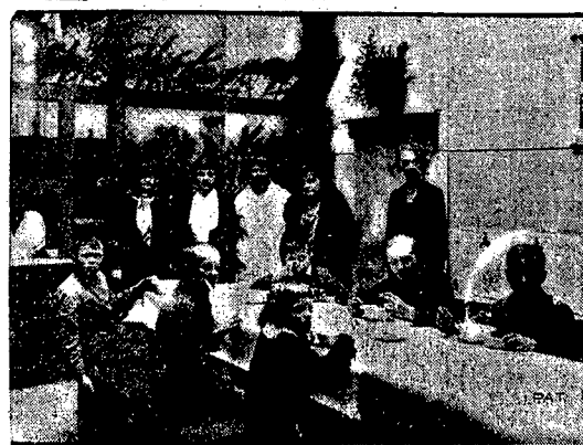
Inspekcja w stacji dożywiania.