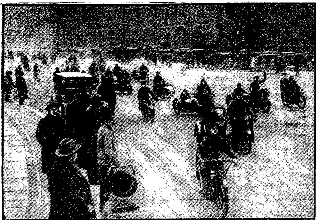
Wielkie wyścigi samochodowe i motocyklowe. W tych dniach odbyły się pierwsze na otwarcie sezonu wielkie wyścigi pojazdów mechanicznych przy udziale 700 samochodów i motocykli na dystansie Berlin — Neuruppin. Na zdjęciu: start motocykli na berlińskim placu zamkowym.