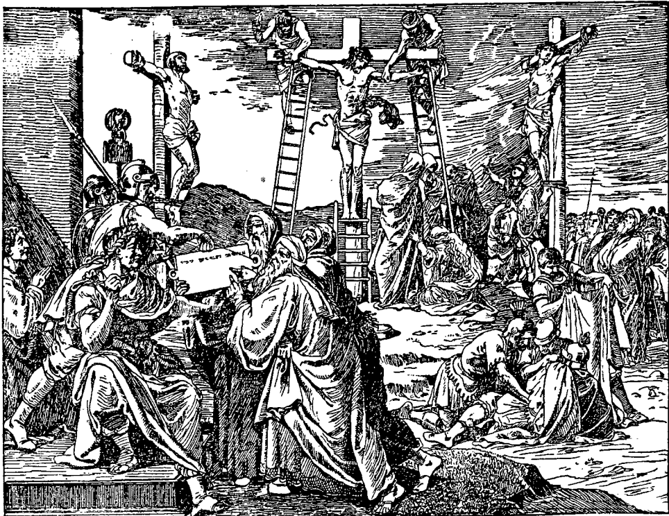
„Wzięli Jezusa i uprowadzili. A dźwigając na Sobie krzyż, wyszedł ku miejscu, zwanemu Trupa Głowa, a po żydowsku Golgota. Tam Go ukrzyżowali, a z Nim dwóch innych, z jednej i drugiej strony, w postrodku zaś Jezusa... A żołnierze zabrali Go zwierzchnie szaty — i podzielili na cztery części... A pod krzyżem Jezusa stały: Matka Jego i siostra Matki Jego, Maria Kleofasowa i Maria Magdalena. ...Gdy zaś Jezus skosztował octu, rzekł: „Wykonano się!” i skłoniwszy głowę, oddał ducha. (św. Jan 19:16-25).

Liczba płatników jest dość wysoka, nie obejmuje wszakże całej ludności dorosłej. Ponieważ według ostatniego spisu ludności Polski wynosi 32 miliony, licząc przeto przeciętnie po 5 osób na rodzinę i przyjmując, że opłaca podatek tylko głowa rodziny, powinniśmy otrzymać 6.400.000 osób, opłacających państwowe podatki bezpośrednio. Podsumowana ilość płatników bardzo jest bliska tej liczbie, wynosi bowiem 6.365.399, ale liczba osób opłacających faktycznie podatki jest znacznie niższa. Tak np. płatników podatku dochodowego jest 1.039.173, lecz liczba osób pociągniętych do obowiązku opłacania te-