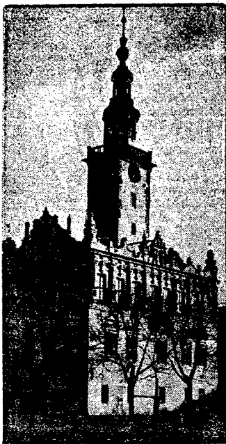
Zabytki architektury na Pomorzu.

Ceny niskie. Wysoki gatunek. Obsługa uprzejma.