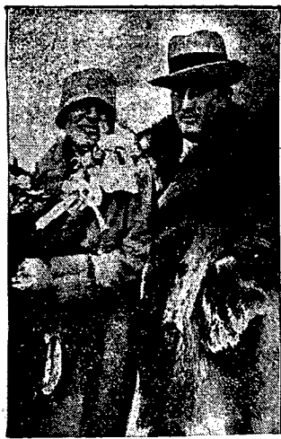
Główna sportsmenka wychodzi za mąż. Słynna mistrzyni tenisa, Zuzanna Lenglen, zaślubiła się z kalifornijskim milionerem M. Baldwinem. — Zdjęcie przedstawia przyszłą parę małżeńską.