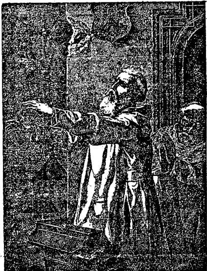
O. Augustyn Kordecki błogosławi żołnierzom broniącym Jasnej Góry.