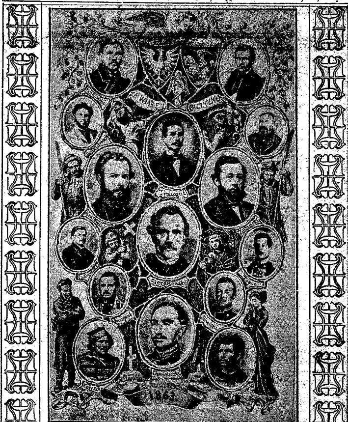
W rocznicę Powstania Styczniowego. Grupa wodzów i organizatorów Powstania 1863 r.