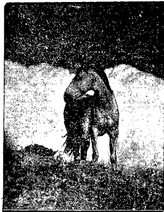
Na dzikich stępach. Nasze zdjęcie nie jest obrazem, lecz rzadką fotografią dzikiego konia na prerjach Ameryki.