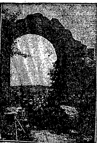
Zabytki Trembowli. W ciągu ostatnich dwu lat przystąpiono w Trembowli do robót celem zabezpieczenia pozostałości zabytków historycznych. Odkopywane są resztki murów. W czasie tych robót natrafiono na zabytki z epoki kamienia luźnego, co dowodzi, że w górze trembowelskiej było już w zamierzchłych czasach, schroniskiem ludzkości. Zdjęcie nasze przedstawia ruiny bramy zamkowej. Wglębi widok na miasto Trembowla.

Jeszcze rok temu wierzone częściami, że do dzie jakos do równowagi politycznej Europy, że będzie można uzdrowić finanse europejskie, że ograniczy się ogólne zbrojenia i położy się przynajmniej jeden kamień pod budowę zjednoczonej gospodarki i politycznej Europy. Tymczasem wszystko pozostało przy