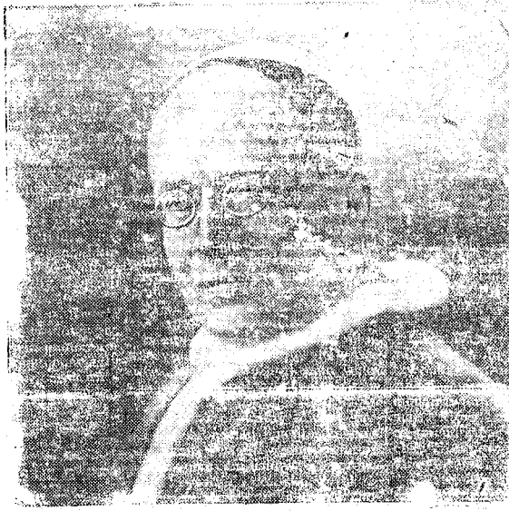
OJCIEC ŚW. PIUS XI.

Już dwa wieki temu Ojczyzna nasza wydała wielkiego męża stanu, który pomyślał o utworzeniu Ligi Narodów, Stanisława Leszczyńskiego. Niesłyszeliśmy ten monarcha powziął myśl stworzenia Ligi Narodów. W memorjalie, przechowywanym dotąd w Nancy tak szczegółowo poruszył całokształt problemów związanych ze stworzeniem takiego międzynarodowego organizmu, iż zdumiewać się należy nad jego przenikliwością i niezwykłą zdolnością do głębokiego wnioskowania i najbardziej skomplikowane zagadnienia. Leszczyński wychodził z założenia, iż pokój nie może być trzymany, o ile nie będzie stworzona Liga Narodów, dążąca do zabezpieczenia pokoju. Zabezpieczeniu takiemu mogą służyć w jego przekonaniamu przedewszystkiem sankcje i jeśli już wybuchy wojny przeszkodzą dzieć nie można, mówi on, to przynajmniej poszukajmy sposobu, aby stał się on katastrofą dla tych, któ-