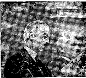
Janusz ks. Radziwiłł, założyciel nowego stronnictwa konserwatywów.

Przechodząc teraz do wpływów nadzwyczajnych. Budżet ten ostateczny w dziale tych wpływów przewiduje 691 000 złotych; ponieważ jednak państwowy podatek od nieruchomości