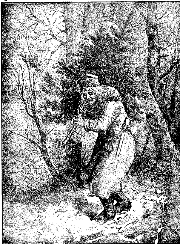
Zbliżono się świętu. Dzień radości się, że rodzice szykują na świętą prezenty i choinki, odwiezione błyskawicami i cukierkami. W ostatnich dniach przed świętami, waga się ożywienie w handlu, bowiem przygotowania świąteczne zapo- Z tych przeto względów wydaliśmy dzisiejszy numer przedświąteczny w powiększonym formacie z obserwowanym uwzględnieniem działu handlowo-ogłoszeniowego.