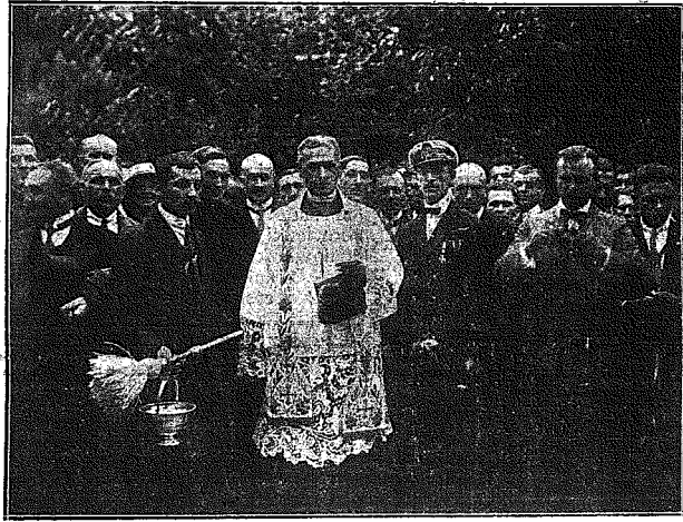
Zdjęcie z uroczystości otwarcia i poświęcenia Wystawy Rolniczo-Przemysłowej w Częstochowie.

Ginie walka klas, a pozostaje współpraca klas, czyli wzajemne łączenia się z narodem dla dobra narodu . G. T.