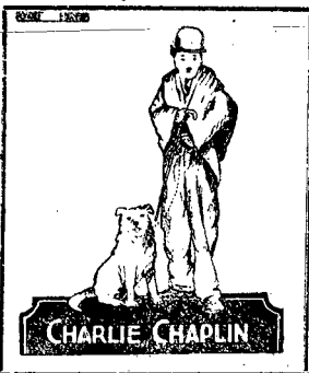
Początek przedstawień w niedziele i święta o godzinie 3-iej, w soboty o godzinie 4-iej, a w pozostałe dni o godzinie 5-iej po południu.

Aby udostępnić wszystkim obejrzenie tego wyjątkowego arcyfilmu, pomimo olbrzymich kosztów obrazu. Ceny miejsc popularne: krzesło tylko 1 złoty (z podatkiem).