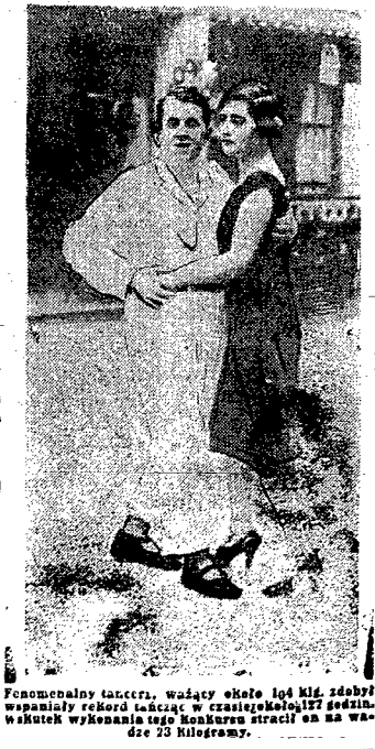
Fenomenalny taniec. Ważący około 100 kg. zdobył wspaniały rekord tańcząc w czarnym kołnierzu 177 godzin. Wskutek wykonania tego karkasa stracił on na wadze 25 kilogramy.

Zebrań REPREZENTANTÓW TOWARZYSTWA według następującego programu: 1) Wybór przewodniczącego; 2) Zatwierdzenie sprawozdania i bilansu za 1925 r. i budżetu na 1926 r.; 3) Wybory 3 członków Dyrekcji i 3 członków Komitetu Nadzorczy; 4) Sprawozdanie w sprawie utworzenia Związku Towarzystw Kredytowych Miejskich; 5) Wnioski Członków i Władz Towarzystwa, zgłoszone w myśl art. 77 Ustawy Towarzystwa Kredytowego, na zasadzie uwagi do § 74 Ustawy Towarzystwa, uważane będzie za prawomocne bez względu na liczbę przybyłych na nie Reprezentantów.