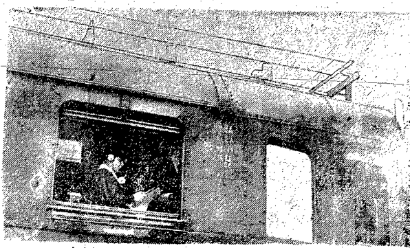
Wielkie ekspresy na kolejach niemieckich zaopatrzone zostały ostatnio w aparaty radio-telegraficzne. Podróżni więc mogą w ten sposób komunikować się ze swoimi przyjaciółmi podczas podróży.

Lewi ojowicie miasta wraz z galerją rzucali potężne słowa: „Precz z tyranami, precz z zdziercami, niech zgini stary podły świat” — co należał sobie tłumaczyć chęcią wprowadzenia radykalnych zmian i porządków w mieście, stosownie do zgłoszonych deklaracji, a co ostateczny swój wyraz znaj-