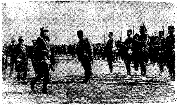
Wojna w Marokko.

DZIENNIK POLITYCZNY, SPOŁECZNY, EKONOMICZNY I LITERACKI.