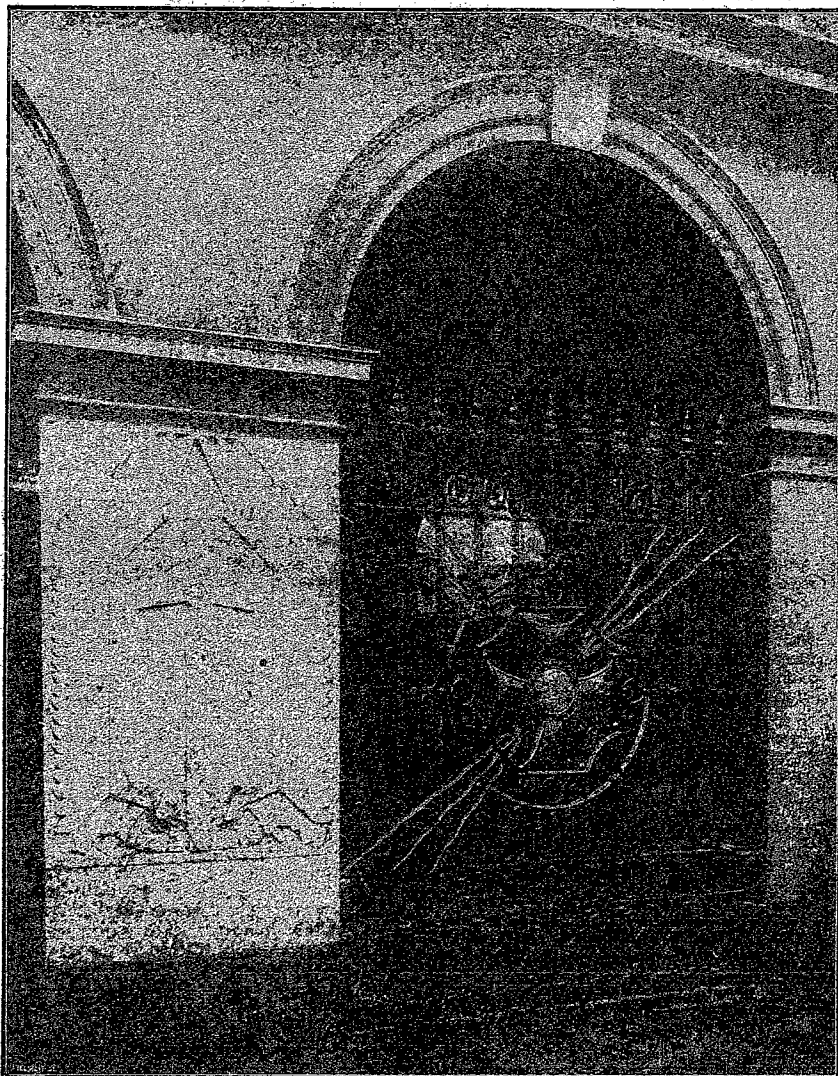
Klisza nasza przedstawia fronton grobowca Nieznanego Żołnierza, którego cały naród polski uroczystie uczcił w dniu 2 listopada 1925 r.