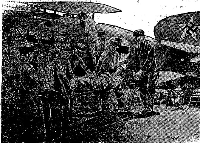
Aparat ten przeznaczony dla trzech rannych. Na 2 miejsca leżące dla ciężko rannych i 1 siedzące dla lżej rannych. Aparaty te uratowały dużo osób od śmierci, ponieważ w przedkim czasie sprowadziły rannych z placu boju do szpitala.