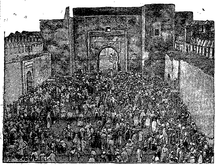
Marokańcycy przed pałacem sultana.

Miało to wszystko swój bardzo dodatni rezultat, ale pociągnęło za sobą inne konsekwencje. Dodatnie wyniki wydadniły się w osłabieniu i zmniejszeniu napaдów dywersyjnych; teraz rzadko kiedy słyszmy o przekradzeniu się band na nasz teren, jakkolwiek często zdarzają się uśmiewania przejścia granicy. Komuniści wobec znikomych wyników swych zabiegów, czynionych z wielkim nakładem pracy, sił i funduszy, bardzo często żądali od pupilów swych jakichś czynów, aktów teroru, byleby tylko siać na naszym pograniczu niepokój i zamieszanie. Nieważniś swą kierował przede wszystkim przeciwko KOP-owi. Niema wprost tygodnia, by od wiosny nie zanotowano napaду na nasze posterunki