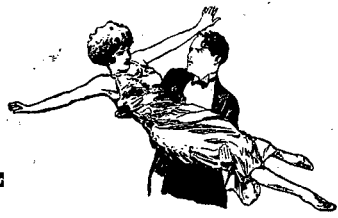
Kobieta szalejąca dla utrzymania się w stanie upojenia gotowa jest poświęcić wszystko — nawet siebie.

Dnia 3-go Maja 1925 roku. w TEATRZE „NOWOŚCI” Teatr Ludowy z Sosnowca Odegra sztukę historyczną w 7 obrazach p. t.