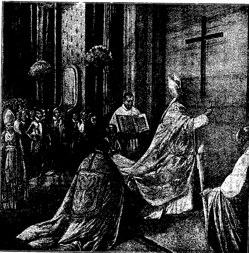
„OTWÓRZCIE DRZWI. ALBOWIEM PAN JEST Z NAMI”.

W obecnym Roku Jubileuszowym tysięczne rzesze polskich pątników zanoszą się do grobu świętego Piotra modły do stóp tronu Pana Najwyższego za pomyślną przyszłość naszej Ojczyzny. Niechże więc do modłów pielgrzymów dołączą się i korne błaganie całego narodu polskiego, gorąco przywiązanego do wiary katolickiej, aby przyszłe nasze losy na zawsze pobożone były ściślemi węzłami przymierza ze Stolicą Piotrową. R... Częstochowa, 4. IV. 1925 r.