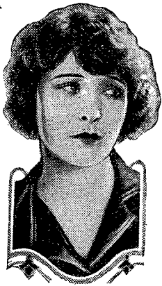
Elsie Ferguson in the Paramount Picture "OUTCAST"

DIENNIK POLITYCZNY, SPOŁECZNY, EKONOMICZNY I LITERACKI.